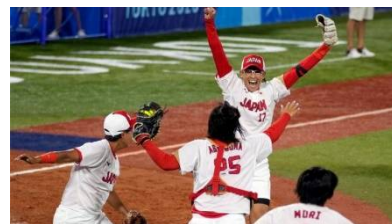
ソフトボール金メダル